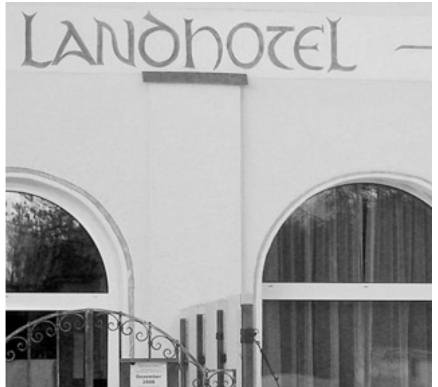
Beim Landhotel Meierei hing am Dienstagmorgen noch immer das kleine Schild (am Eingangstor) mit dem Hinweis auf die Dezember-Eröffnung.